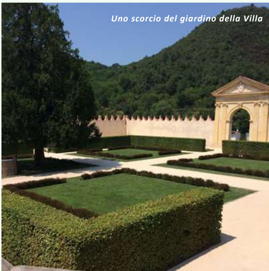
Uno scorcio del giardino della Villa