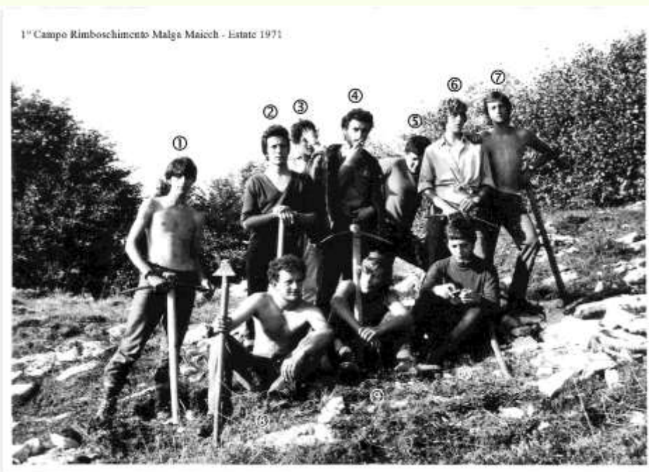
Il 1° Campo Rimboschimento 1971—Già dagli albori, Wigwam comunica coerenza

A tutti i cittadini che hanno a cuore i temi dello sviluppo equo e sostenibile delle proprie Comunità Locali e siano de-