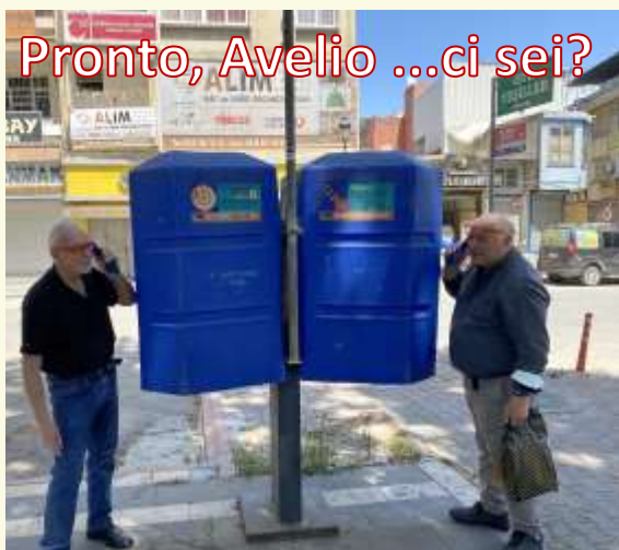
9 maggio 2022 in Turchia, all'Adana Sheraton Hotel Avelio maestro di spaghetti alla chitarra