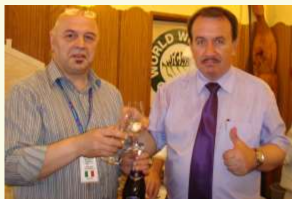
Avelio a Zator col governatore della Malopolska (PL) nel 2009, quando e dove è nata "La Via di Karol"

" THE INNOVATIVENESS OF RURAL AREAS IN URBANISED TERRITORIES" Krakow Conference 29-30 June 2017