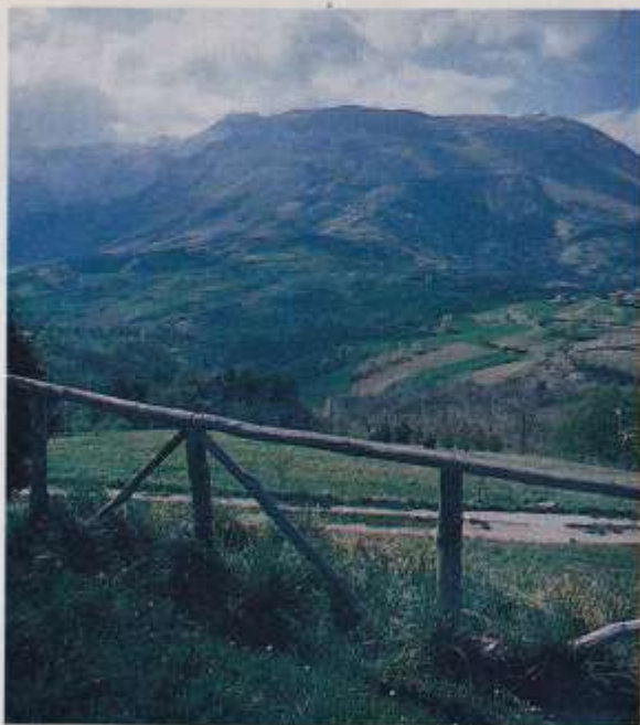
Una veduta dei monti Sibillini. In alto, la peonia suffruticosa.