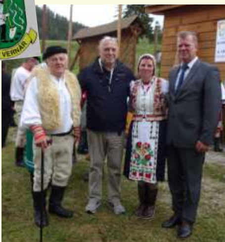
Avelio a Vernar sul tratto slovacco de "La Via di Karol"