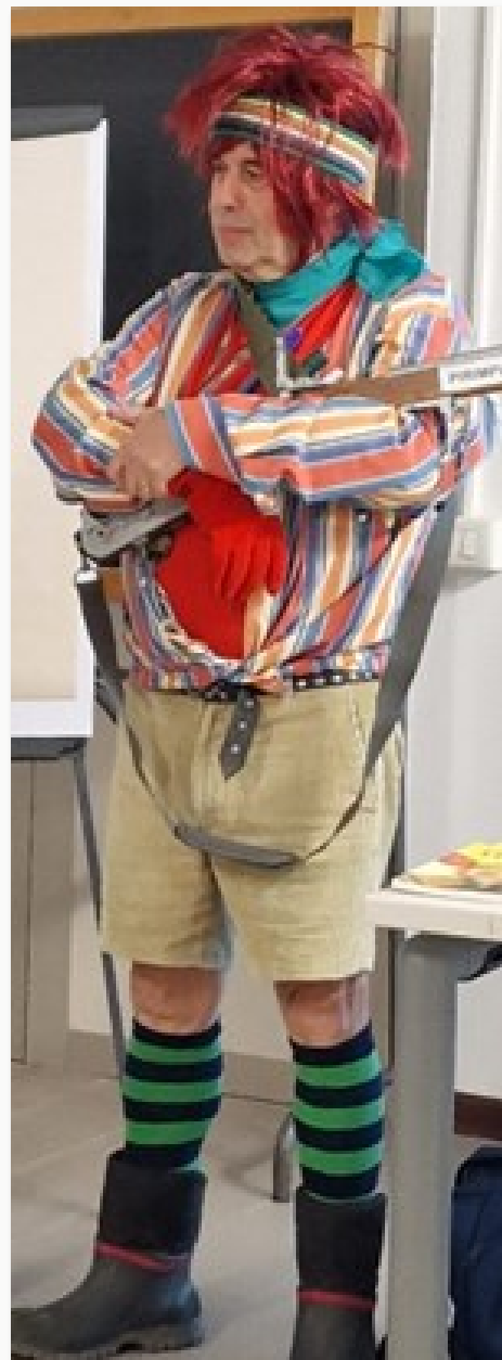
Il personaggio di Pirimpino