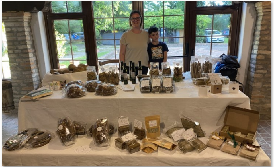
I prodotti alimentari alla canapa dell'Azienda Canalpè di Lentiai di Borgo Valbelluna (BI)