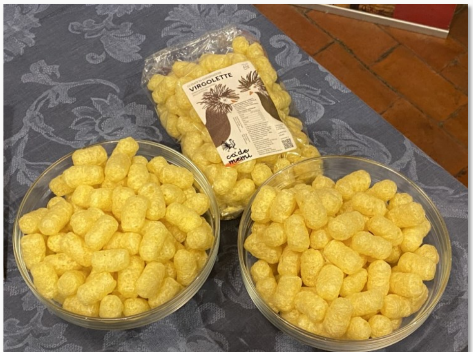
Le virgolette al mais di Cà De Memi