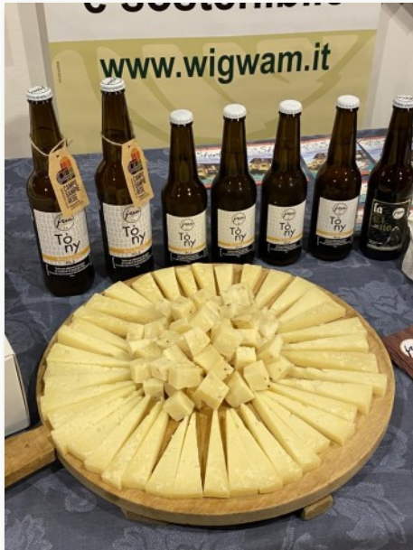
La caciotta veneta stagionata del Caseificio Franceschi e le birre artigianali dell'Agribirrificio Fria

all'apertura della degustazione, che mai delude le aspettative dei partecipanti. Protagonisti i produttori del Camposampierese: Rio Storto, Barduca, BioEssenza, Ca' De Memi, Salsa Tolomei, il Caseificio Fransceschi, Fria.