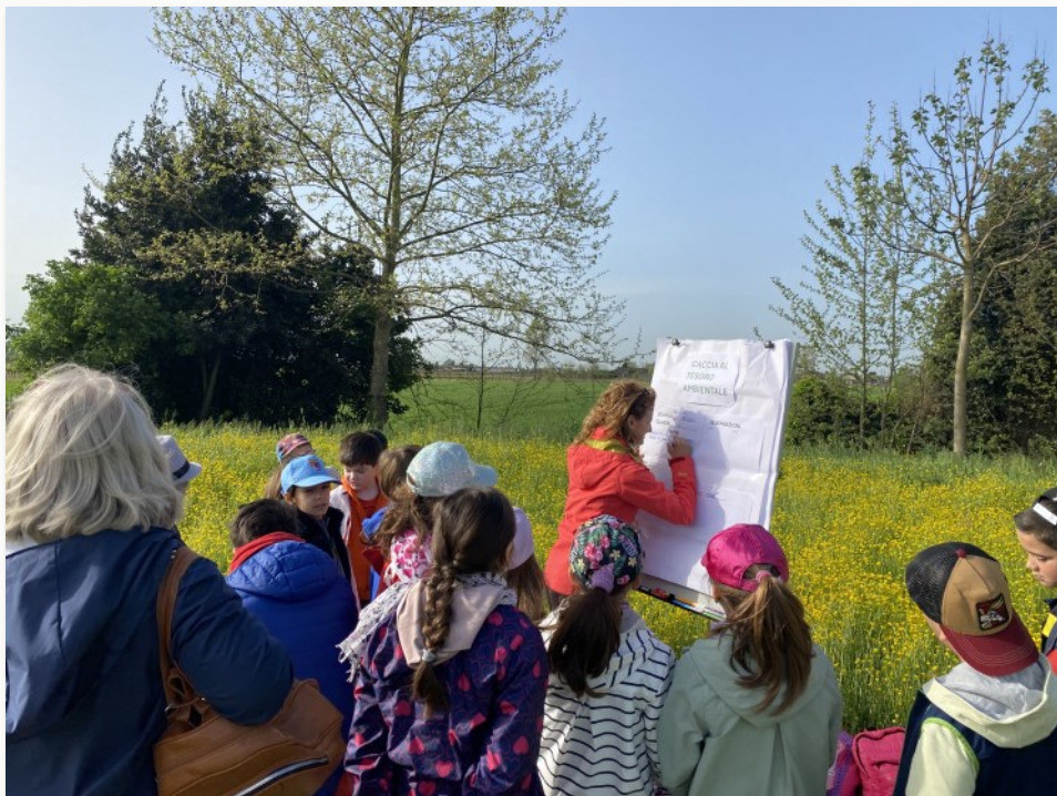
Un momento della Caccia al Tesoro Ambientale