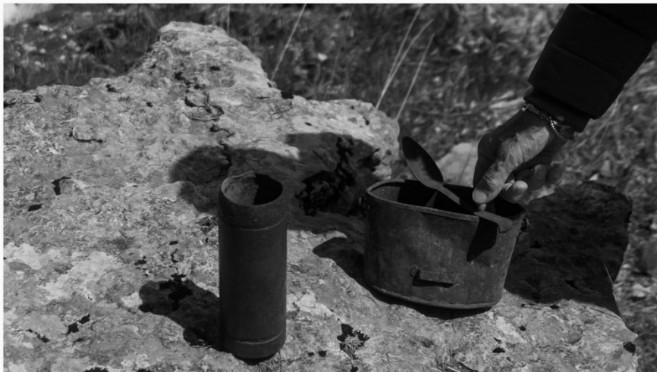
Reperti della Grande Guerra ritrovati dai recuperanti

venimenti legati alle due Grandi Guerre sono il filo conduttore della vicenda di Giacomo), con riflessioni sul tempo che passa e sull'importanza di preservare i ricordi.