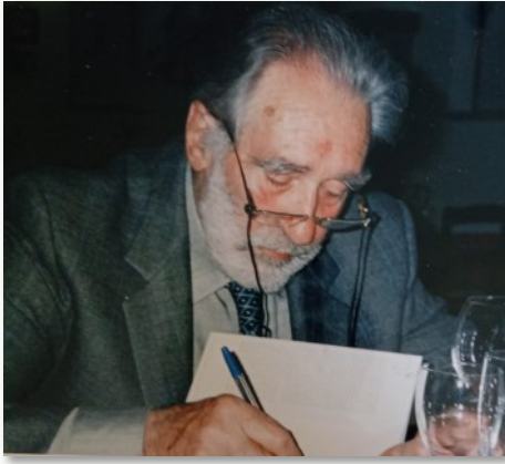
Mario Rigoni Stern

zione visibile, è il luogo stesso o il paese; e le fattezze e il linguaggio che gli sono propri sono la configurazione del terreno, la pendenza delle vie, il suono delle campane... Sebbene ciò che chiamo Genius Loci non possa essere personificato, può accadere di sentirlo più vicino e più intenso in qualche singolo monumento o in qualche tratto del paesaggio.