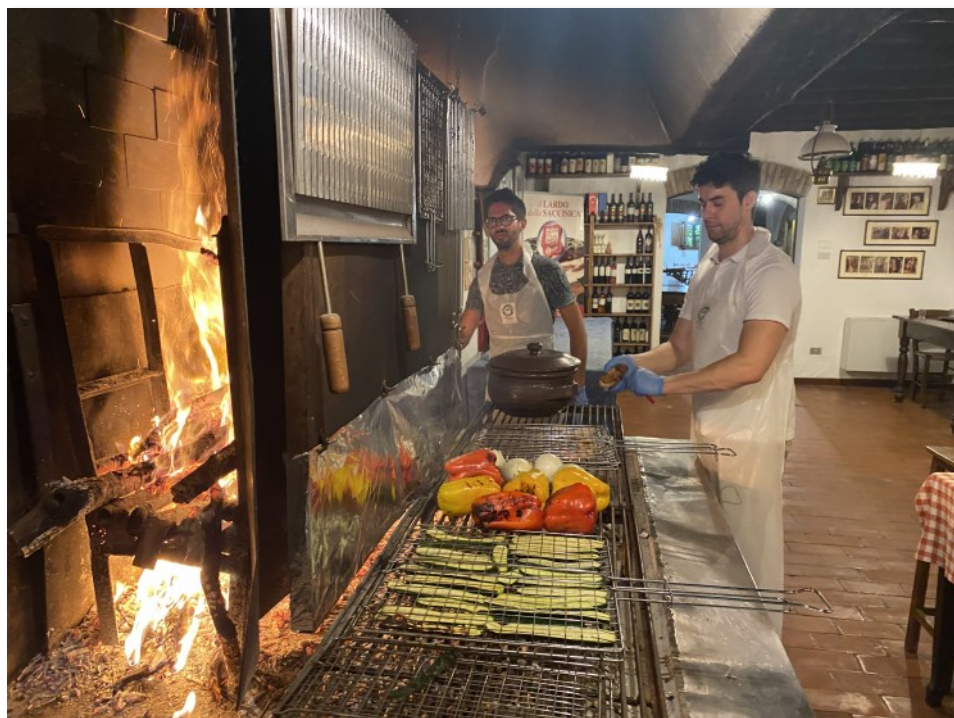
Impariamo a fare le grigliate su un focolare antico

stata un'esperienza piacevole lontano dalla tecnologia e a contatto con la natura. Mi è piaciuto trascorrere un po' di tempo con le persone con cui lavoro lontano da questioni lavorative. Grazie per la bella giornata!