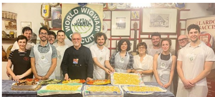
15 GIOVANI TALENTI DI NEWTWEN AL WIGWAM

La sede principale del Circolo di Campagna Wigwam "Arzerello" APS di Piove di Sacco (Pd) è stata la location ideale per realizzare questo progetto formativo.