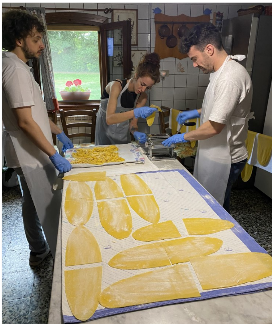
Tagliatelle fatte in casa come una volta, che bontà!