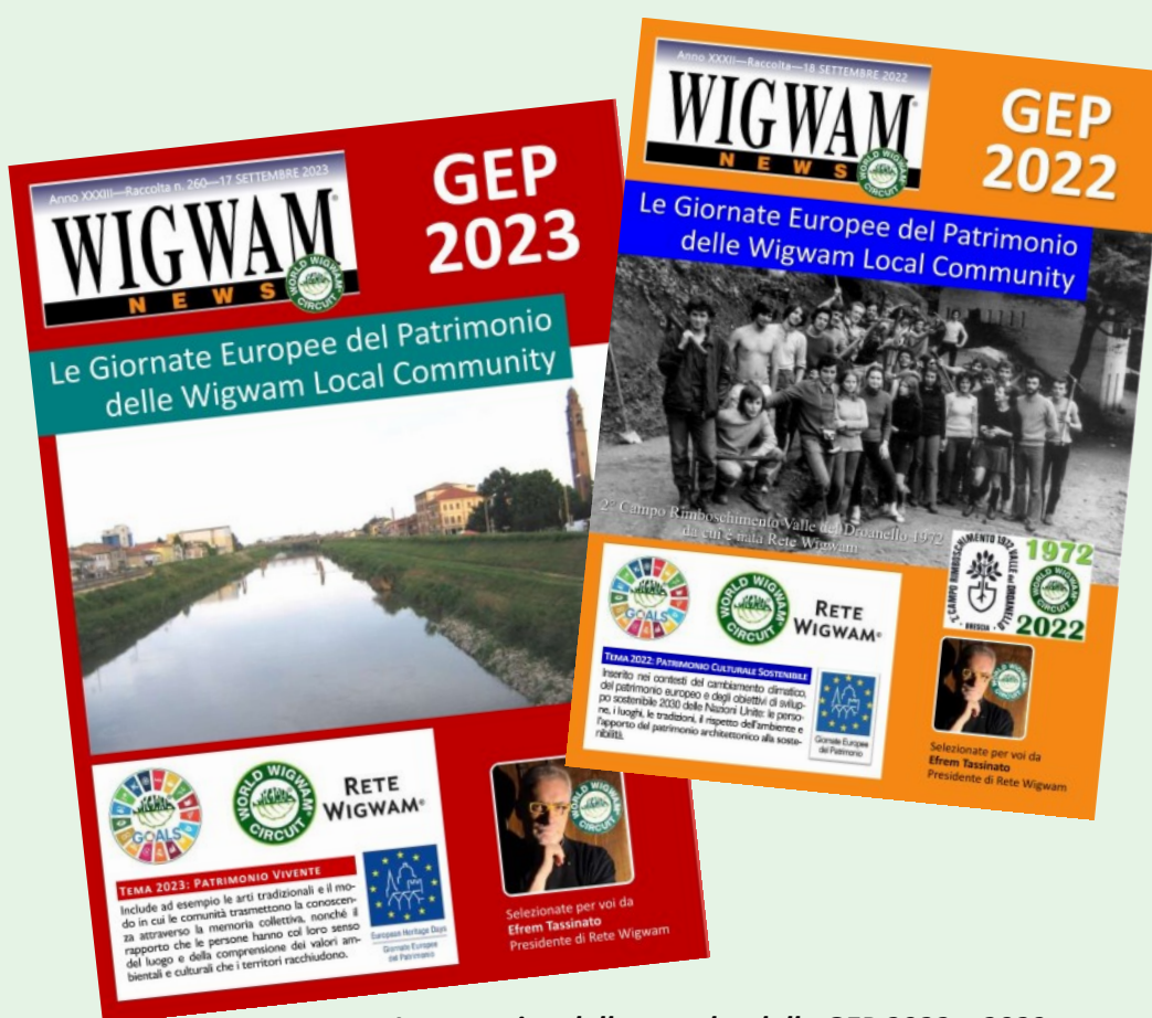
Le copertine delle raccolte delle GEP 2022 e 2023 di Rete Wigwam