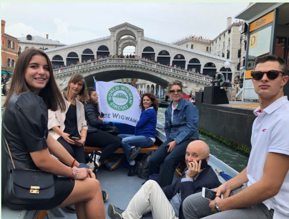
Altri due momenti a Venezia dello staff Wigwam in epoca pre-pandemia

Si invita dunque a prendere in considerazione il patrimonio culturale di ambito locale collocandolo in una dimensione più ampia, e a cercare in esso le tracce delle relazioni fra le genti che si sono mosse per terra e per mare, incontrandosi e condividendo conoscenze, pratiche culturali e artistiche, ma anche attività commerciali, credenze religiose, abilità artigianali e agricole, innovazioni tecniche.