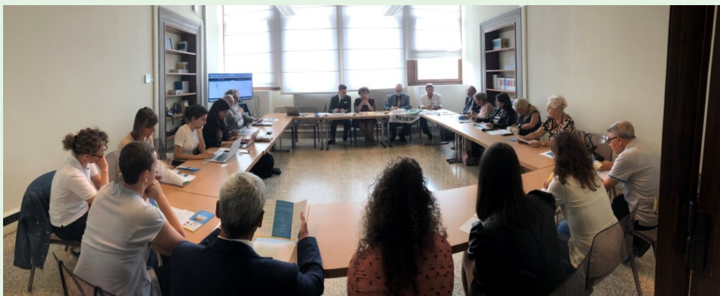
Due momenti dell'incontro all'Ufficio Italiano del Consiglio d'Europa. A Venezia, con affaccio su Piazza San Marco