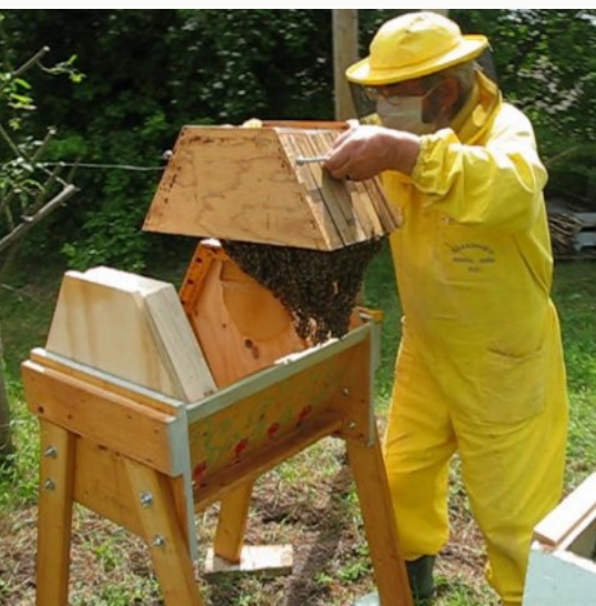
Travaso dell'arnia cattedrale

teragito con le loro proposte architettoniche come ad esempio le fessure di ventilazione superiore sulla barra.