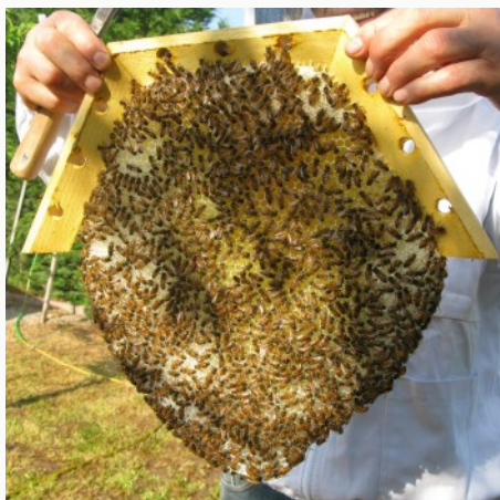
Un favo dell'arnia cattedrale

Dobbiamo cominciare a guardare al futuro e vedere se c'è qualcosa che possiamo innovare nel disegno dell'alveare che possa aiutare la colonia d'api a sopravvivere alle oscillazioni estreme di