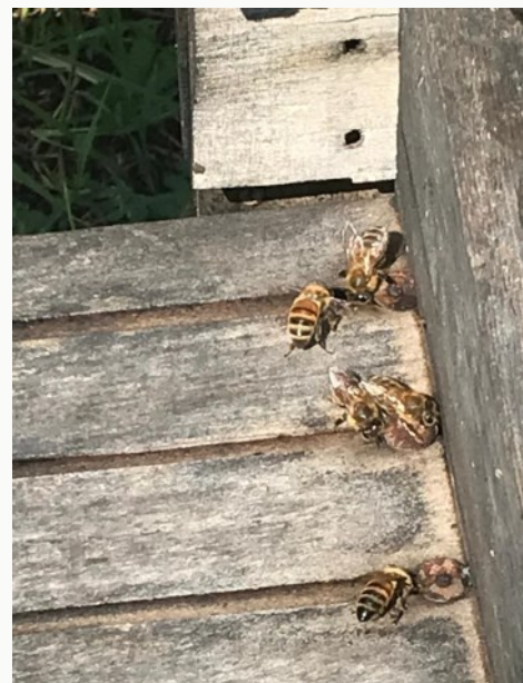
Abbeveratoio per le api

E' un'arnia il cui impiego è iniziato in Italia nel 2016 a Verona, sin dall'inizio dell'esperienza viene costruita e si può acquistare presso: