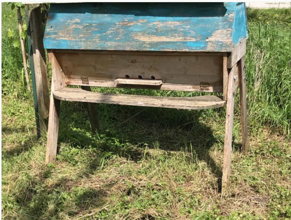
Una vecchia arnia cattedrale pienamente funzionante

temperatura ed ai nuovi cambiamenti stagionali che si stanno verificando.