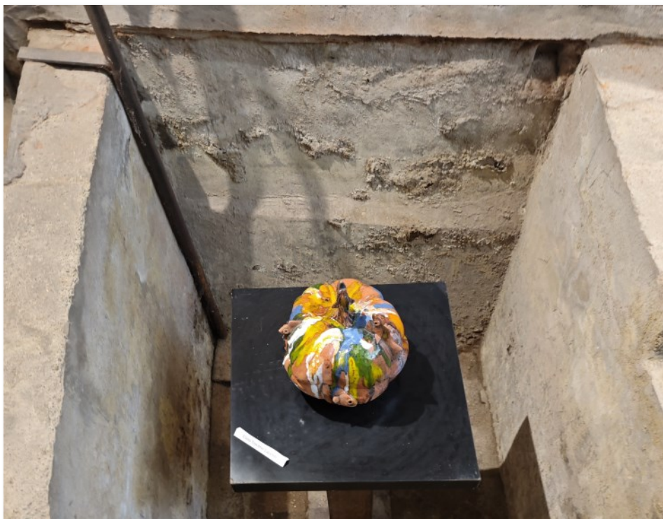
Vasca di decantazione dell'argilla

sono visibili i muè (particolari murate composte di mattoni a sbalzo ove veniva gettata la terra per una sua ulteriore raffinazione).