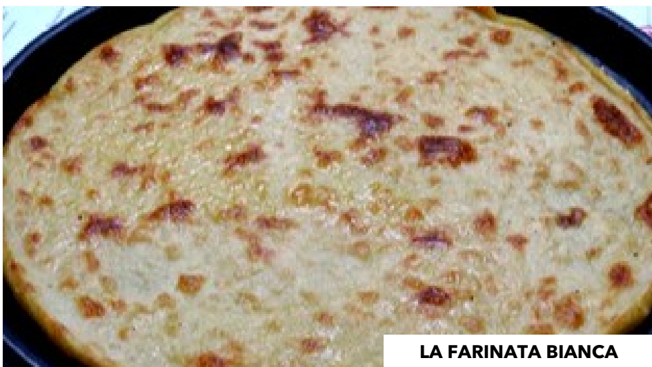
LA FARINATA BIANCA