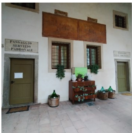
Uno scorcio della Corte Benedettina di Correzzola adibita a hotel