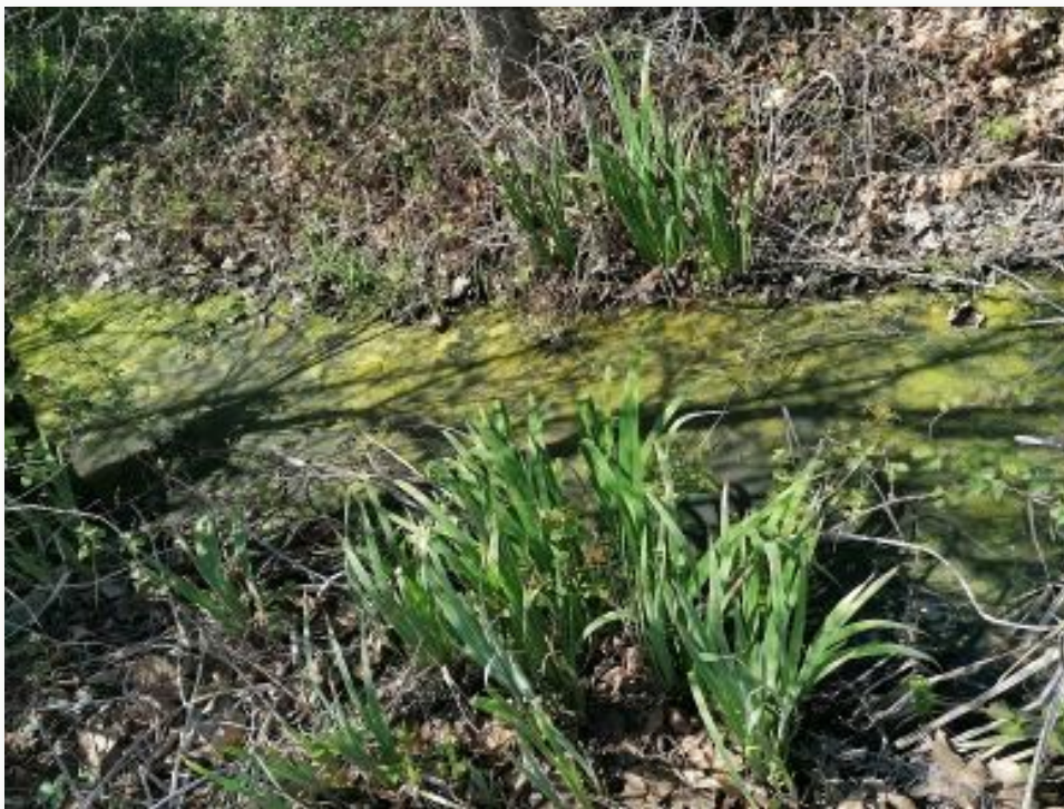
Alge verdi che crescono nell'acqua del fosso, quando scarseggiano le precipitazioni e sono alte le temperature

È tutto questo equilibrio naturale, fragile e delicato, che noi dobbiamo cercare di ripristinare e rispettare se non si vuole che una specie prevarichi sull'altra, a danno delle più deboli che possono persino essere estinte per sempre ■