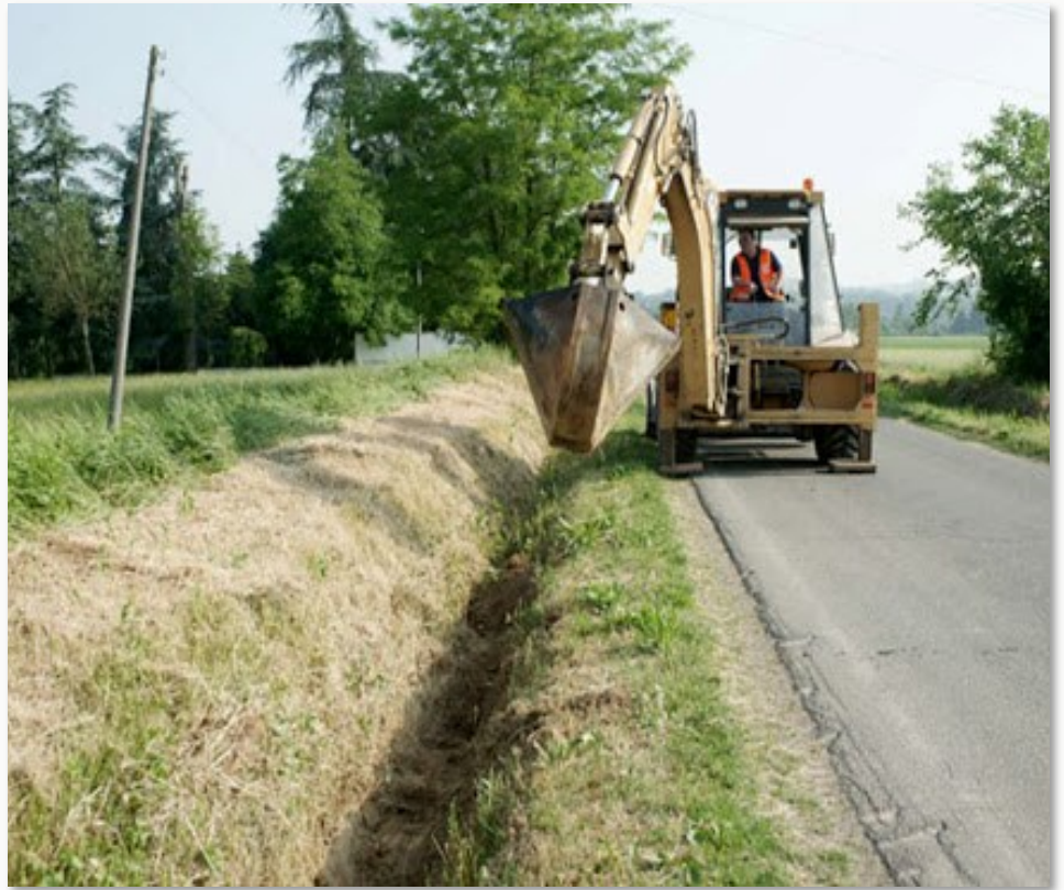
Manutenzione e pulizia dei fossi stradali deputati al drenaggio e alla raccolta delle acque piovane

A metà strada, fra l'acqua e la riva troviamo gli