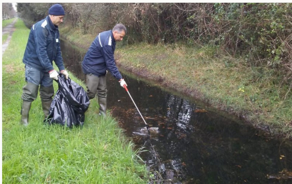
Operatori del Consorzio di Bonifica durante le attività di pulizia dei fossi, dove accertano la presenza di tritoni

Per non parlare della fauna: nel fondale melmo-